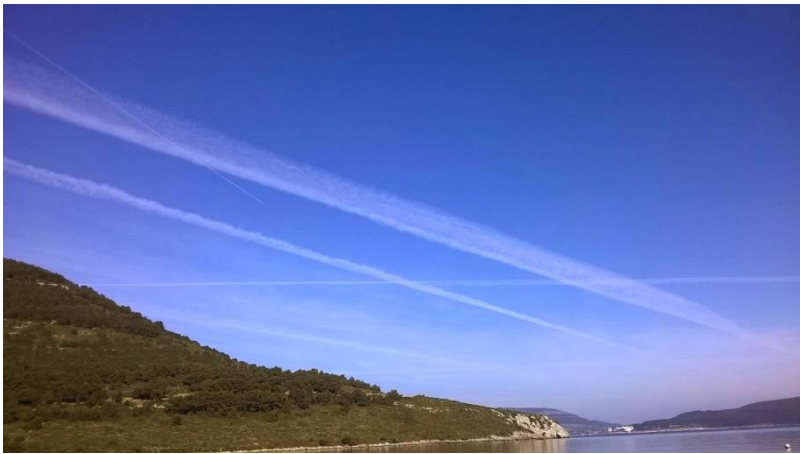
ITALIA (19 MARZO 2014): SCIE CHIMICHE MILITARI NATO