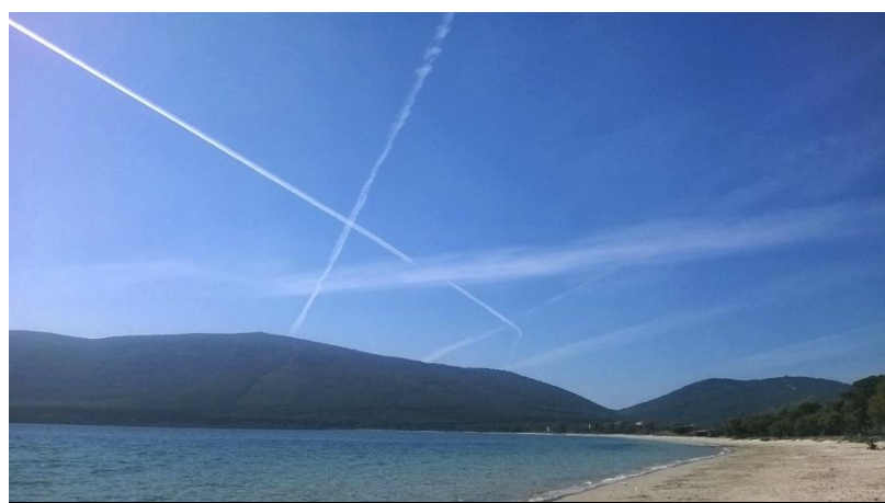
ITALIA (19 MARZO 2014): SCIE CHIMICHE MILITARI NATO